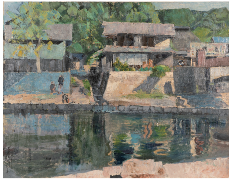
高橋貞一郎《諏訪湖風景》1954年、市立岡谷美術考古館蔵